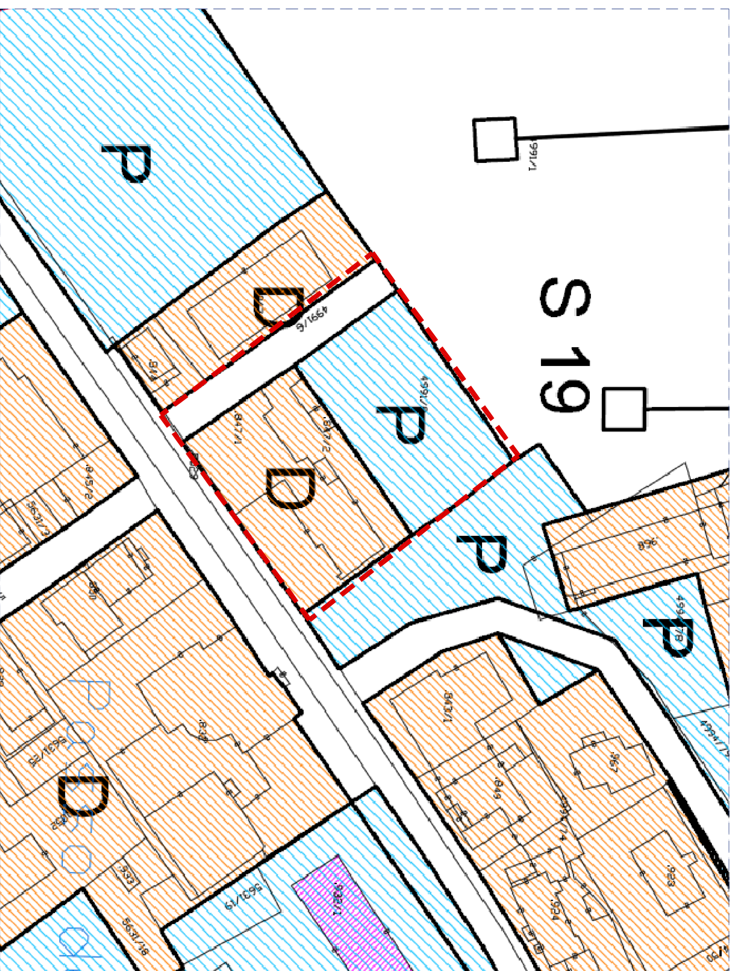
PIANO REGOLATORE GENERALE VARIANTE 2011